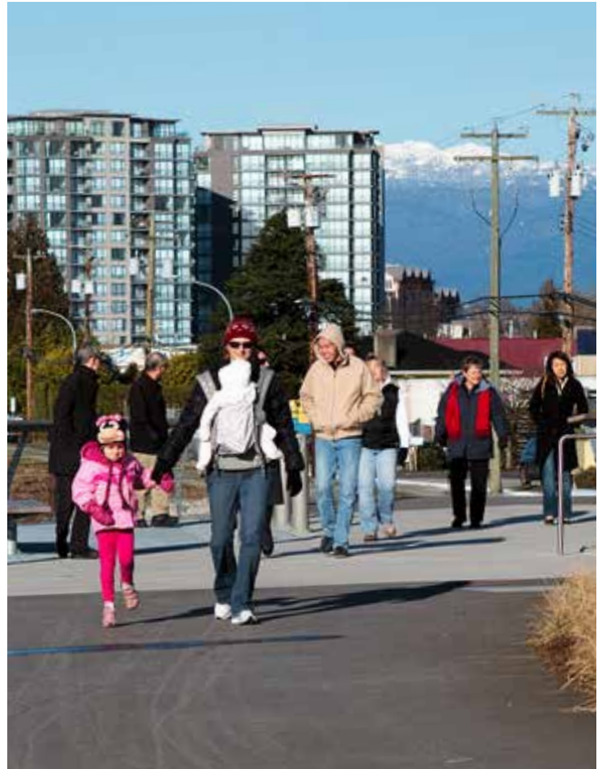
성장 중인 리치먼드 오벌 빌리지 지역

치모 리치먼드 렌트 बैं크(CRRB)는 훼손 보증금이 필요하거나 월세 연체/미납 또는 일시적인 금전 부족이나 재정 위기로 인한 필수 유틸리티 단절로 퇴거 위험에 처한 저소득층 개인과 가정에 상환 가능한 자금을 제공합니다. 자금은 단기 무이자 대출 형태로 제공됩니다. 자세한 정보: 604-279-7170 또는 www.ChimoServices.com/get-help/chimo-richmond-rent-bank