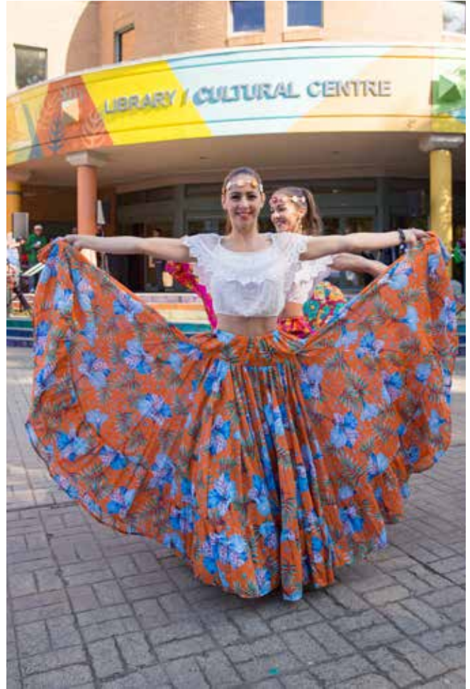
리치먼드 문화의 날

리치먼드는 다양한 문화와 언어, 전통, 관행의 본고장입니다. 시간이 지남에 따라 다양한 그룹이 자체 문화 협회 및 공동체를 형성했습니다. 신규 이민자는 이런 그룹과 연결하여 새로운 친구를 만나고 이곳 리치먼드 생활로의 전환에 도움을 받길 원할 수 있습니다. 민족 단체 목록: www.richmond.ca/discover/com-resources/organizations/arts.htm#EthnicGroups