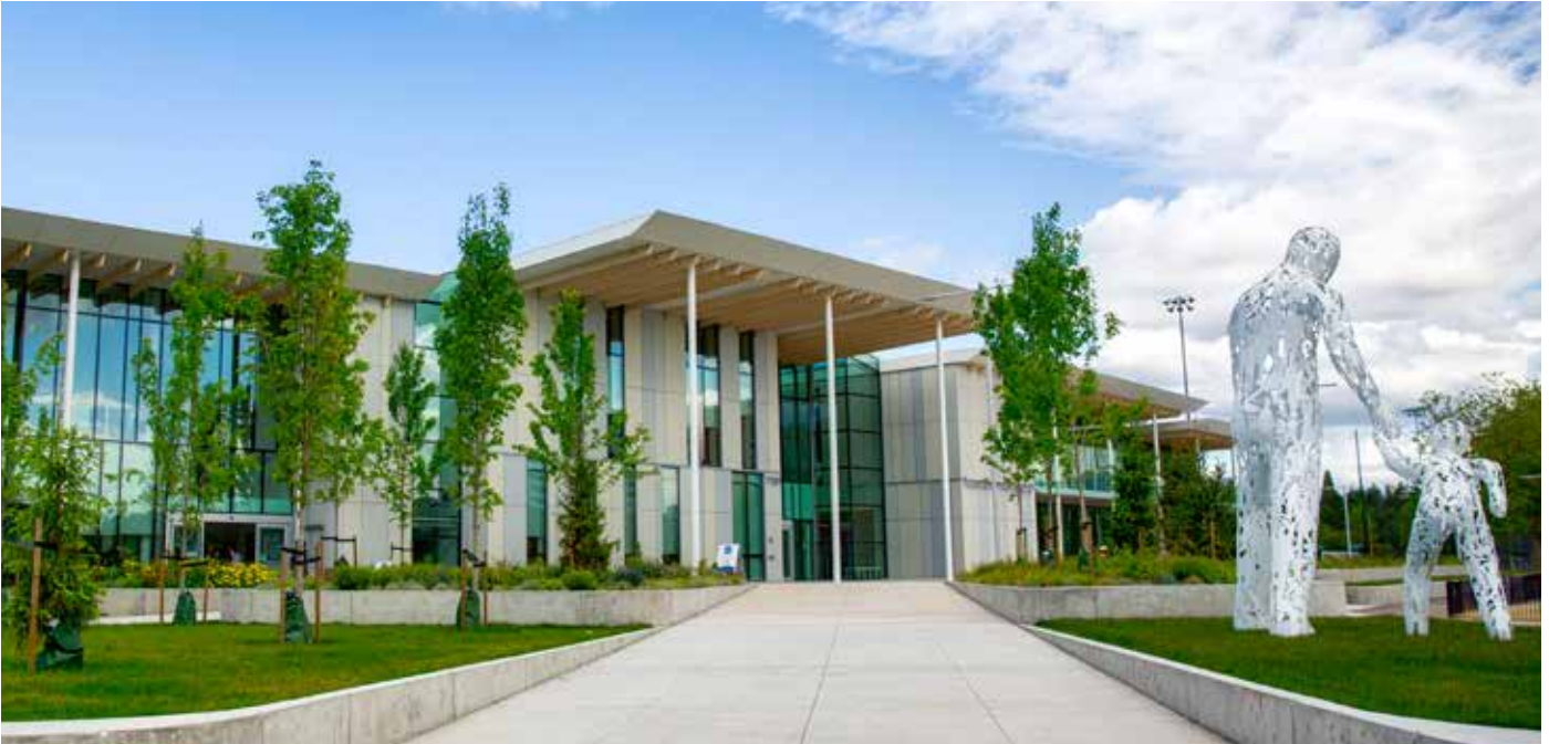
활동적인 생활을 위한 미노루 센터