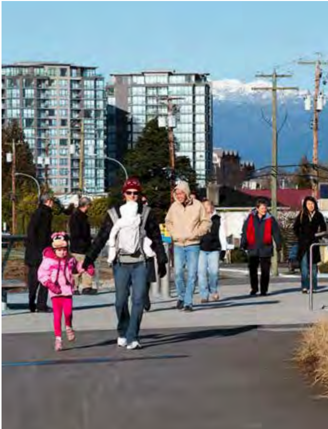
منطقة القرية البيضاء المتنامية في ريتشموند

يوفر مركز موارد المستأجرين والاستشارات (تي آر إيه سي) تعليمًا قانونيًا مجانيًا وتمثيلاً ودعمًا بشأن مسائل الإيجار السكني: ٢٢١٨-٤٣٣-٤٠٤ أو www.tenants.bc.ca