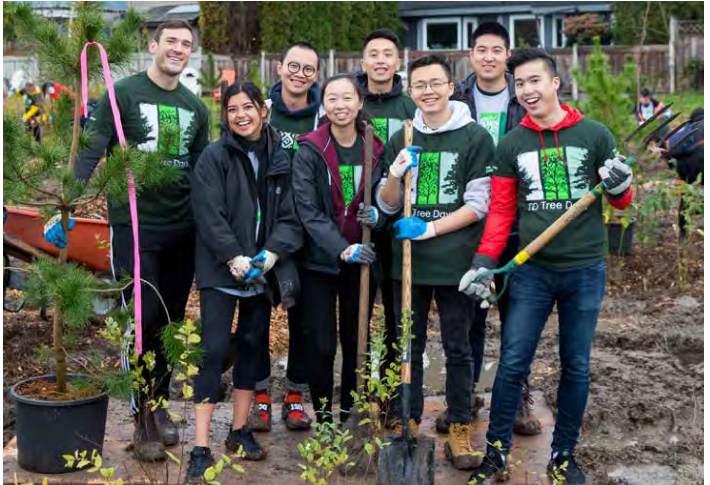
التطوع في حديقة تير انوفا الريفية

غرفة تجارة ريتشموند هي جمعية تجارية ذات عضوية غير ربحية ذات قاعدة عريضة تمثل مصالح وتوفر فرصًا للتواصل لما يقرب من ١٠٠٠ شركة عضو. تشمل الشركات من مختلف الصناعات والمهن وتشمل الشركات الوطنية والدولية والشركات متوسطة الحجم والشركات الناشئة الريادية والشركات الصغيرة. لمزيد من المعلومات www.RichmondChamber.ca