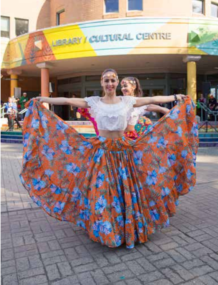
أيام ريتشموند الثقافية