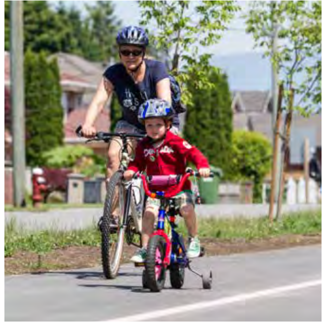
سكة حديد جرينواي

www.icbc.com/road-safety/safer-drivers www.tc.gc.ca