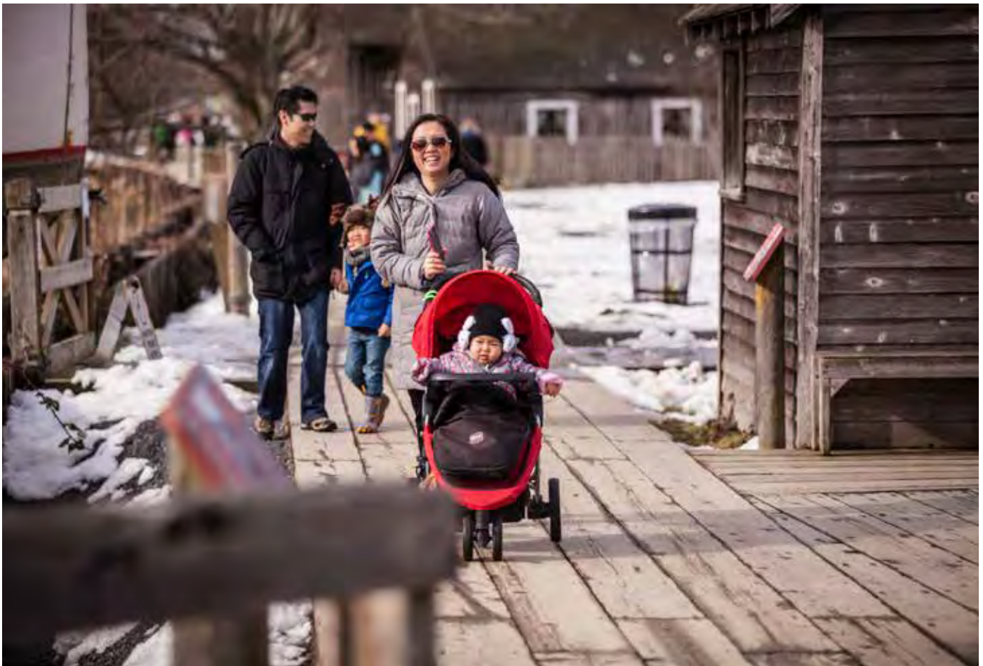
الموقع التاريخي الوطني لأحواض بناء السفن في بريتانبا

وصل المستوطنون الأوروبيون الأوائل في ستينيات القرن التاسع عشر ، بسبب التربة الخصبة في دلتا نهر فريزر. بعد تطهير الأرض وتحفيقها ، تمكن المزارعون من زراعة محاصيل وفيرة من الحبوب والأعلاف والخضروات والتوت. لا تزال زراعة التوت البري والتوت من الصناعات المهمة حتى يومنا هذا.