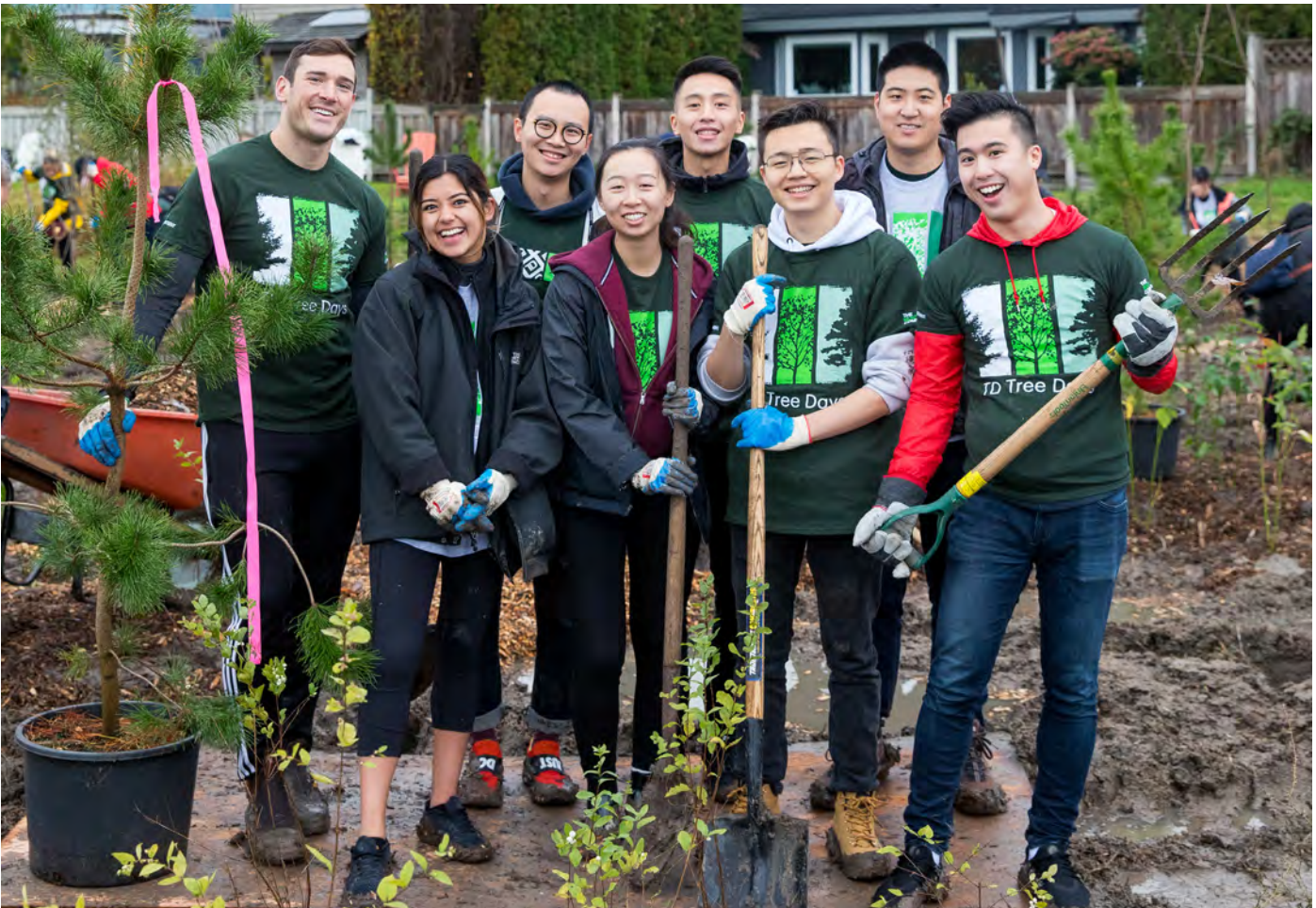
Волонтери працюють у парку Terra Nova Rural Park

Торгово-промислова палата Річмонда — це широкопрофільна неприбуткова асоціація підприємств, яка представляє інтереси й надає можливості налагодження зв'язків майже 1000 компаніям, які належать до неї. Ці підприємства походять з різних галузей і професійних сфер, до них належать національні та міжнародні корпорації, компанії середнього розміру, підприємницькі стартапи й малий бізнес. Докладна інформація: www.RichmondChamber.ca .