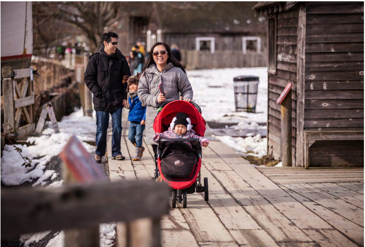
Державний пам'ятник історії Britannia Shipyards

Річмонд і сьогодні є бажаним місцем для проживання для мігрантів з інших частин Канади та багатьох інших країн. У недавні роки більших новоспечених канадців приїхали з Китаю, Гонг-Гонконгу, Філіппін та Індії. Культурне розмаїття міста робить Річмонд місцем, проживання в якому є захопливим і цікавим.