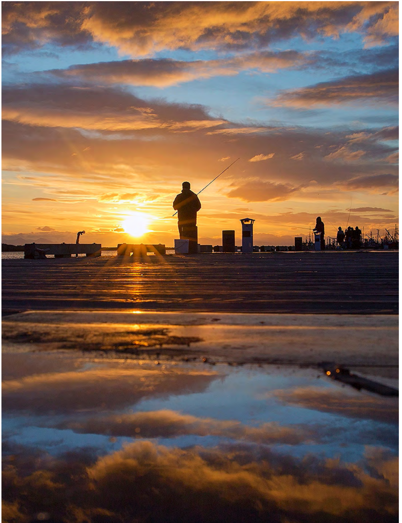
Причал Imperial / Рибальський поплавець