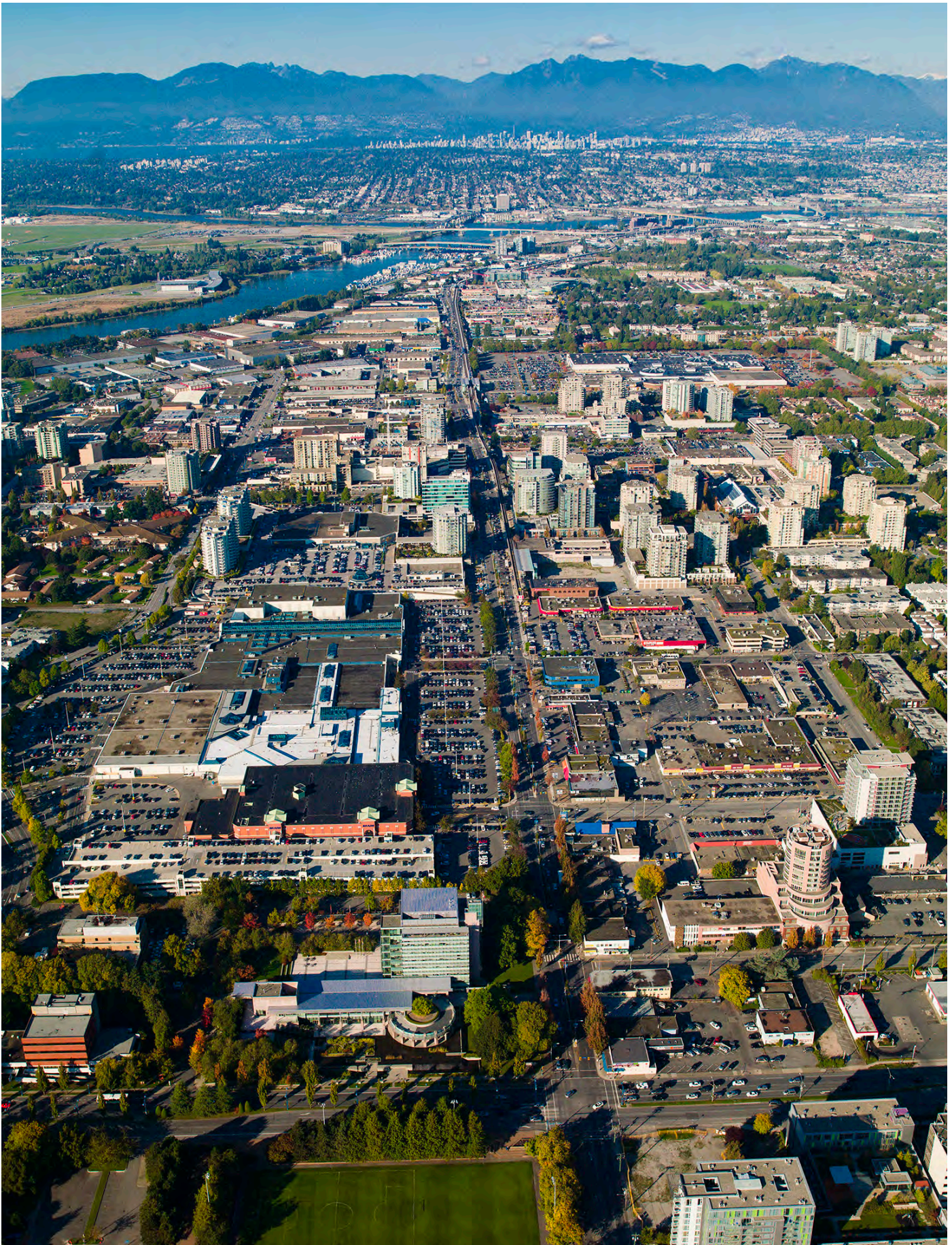
Вулиця No. 3 Road, аерофотозйомка