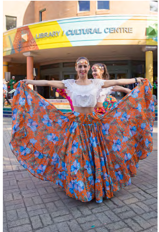
Дні культури Річмонда

У Річмонді проживають представники багатьох культур, носії багатьох мов, традицій і практик. З часом різні групи створили їхні власні культурні асоціації і громади. Новоприбулі можуть виявити бажання долучитися до цих груп, щоб знайти нових друзів та адаптуватися до життя у Річмонді. Дивитися перелік етнічних організацій: www.richmond.ca/discover/com-resources/organizations/arts.htm#EthnicGroups .