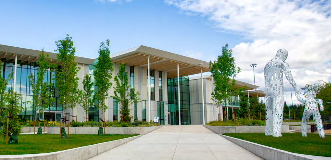
Центр активного способу життя Мінору