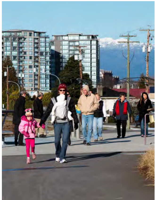
Молодий район Річмонда Oval Village

Chimo Richmond Rent bank (CRRB) пропонує фонд поворотної допомоги особам і родинам з низьким доходом, яким потрібно зробити страховий депозит або яким загрожує виселення через несвоєчасну сплату / несплату орендної плати, або відключення життєво необхідних комунальних послуг через тимчасовий брак коштів або фінансову кризу. Фінансування надається у формі короткострокової безвідсоткової позики. Докладна інформація: 604-279-7170 або www.ChimoServices.com/get-help/chimo-richmond-rent-bank .